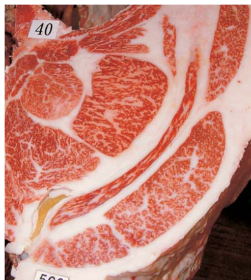
母の父／糸晴美 BMS. No. 7 母の祖父／神高福 ロース芯 51cm 2