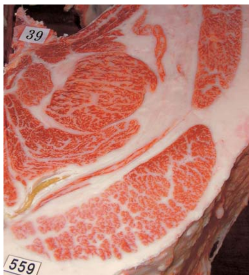
母の父／平茂勝 BMS. No. 10 母の祖父／紋次郎 ロース芯 57cm 2