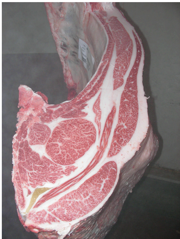
No4 (BMS No8)